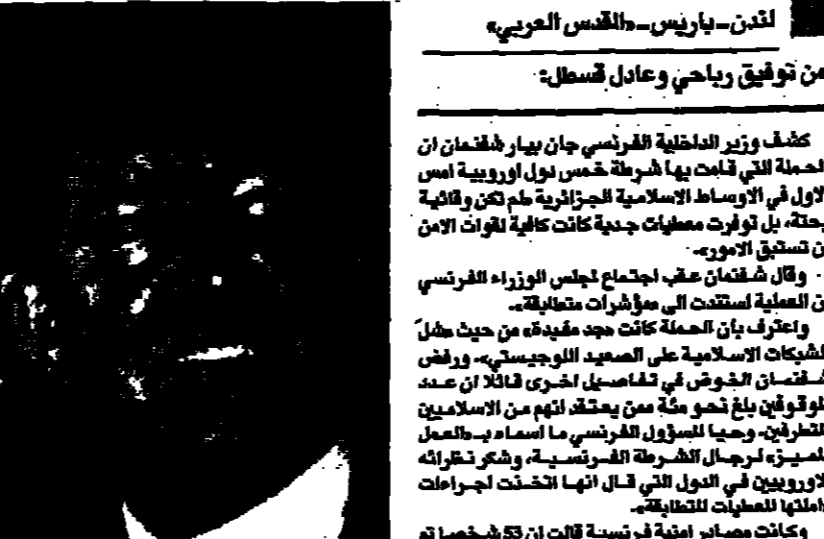
من توقيع رياح و عادل قسطل: لندن - باريس - والفس العربيه

كشفت صحافة فرنسية في بيانها لوسائل الإعلام ان الحملة التي قامت بها الصحافة الفرنسية بقيادة بلادها لاكبر حملة وقائية على الاسلاميين الجزائريين في أوروبا. وقالت الصحافية الفرنسية شذمان في بيانها ان الحملة التي قامت بها الصحافة الفرنسية بقيادة بلادها لاكبر حملة وقائية على الاسلاميين الجزائريين في أوروبا.